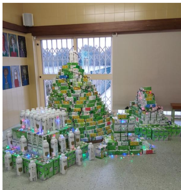
Ilustração 17 - ÁRVORE DE NATAL COM MATERIAL DE DESPREDÍCIO