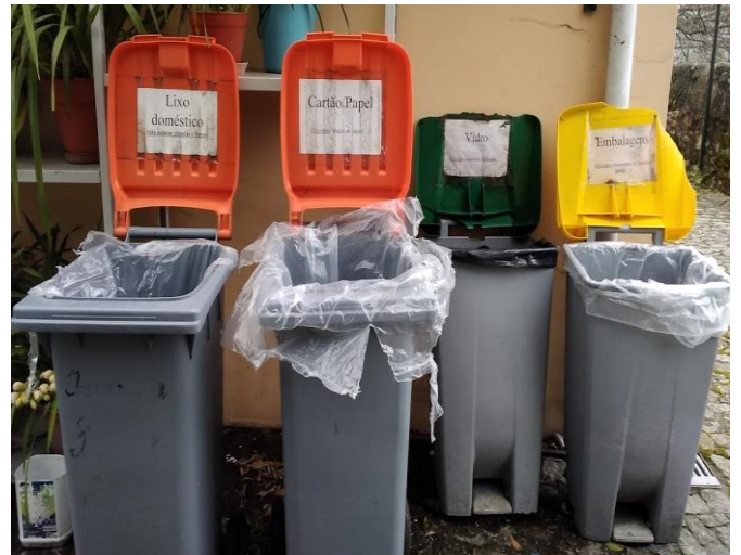
Ilustração 3 - SEPARAÇÃO DO LIXO