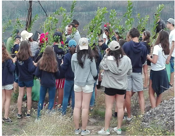
Ilustração 7 - CULTIVO DE ÁRVORES