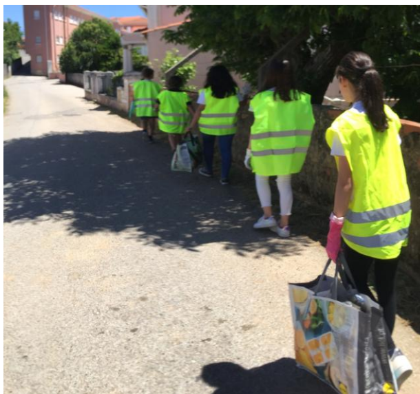
Ilustração 6 - LIMPEZA DE RUA