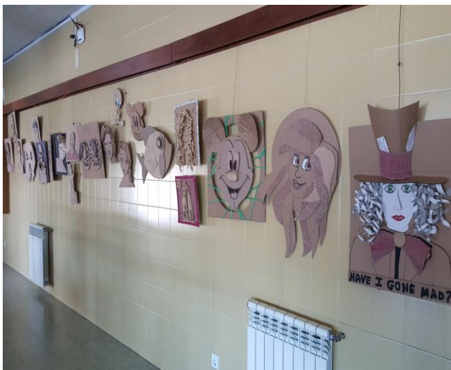
Ilustração 19 - DO DESPÉRDIO À ARTE