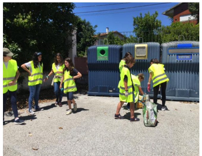
Ilustração 5 - BRIGADAS DE LIMPEZA DENTRO DA ESCOLA