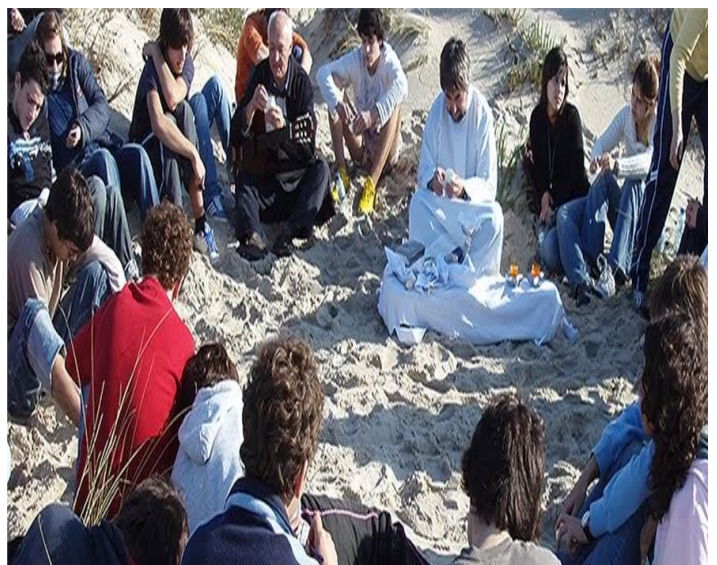
Ilustração 14 - NATUREZA LUGAR DE ORAÇÃO