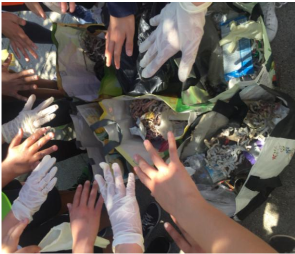
Ilustração 4 - ALUNOS APANHAM PONTAS DE CIGARRO