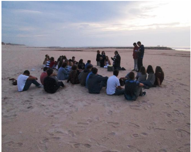
Ilustração 12 - REZAR NA NATUREZA