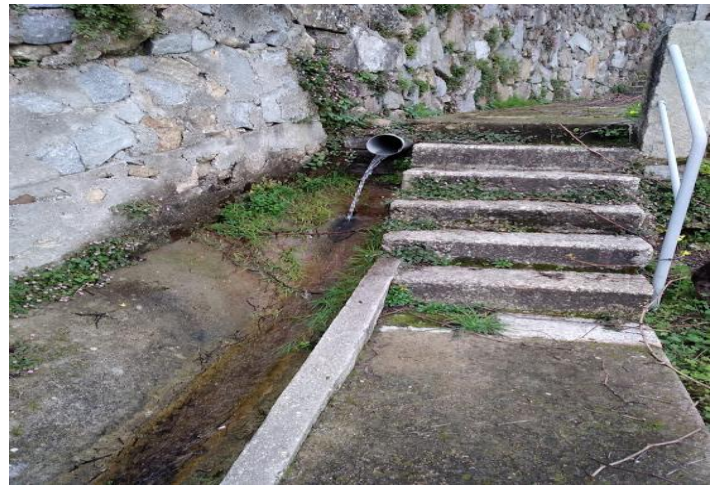
Ilustração 11 - APROVEITAMENTO DE ÁGUA