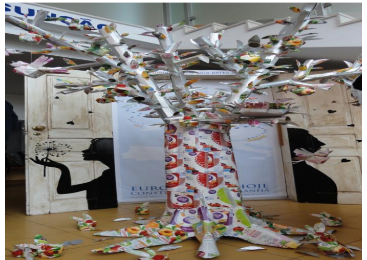
Ilustração 22 - DESENVOLVER A ARTE COM MATERIAL DE DESPÉRDIO