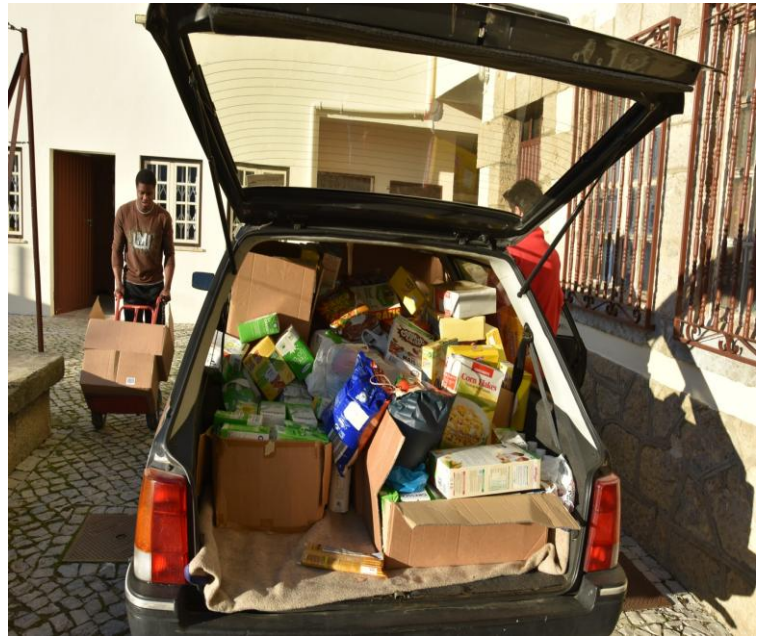
Ilustração 18 - RECOLHA DE ALIMENTOS - BANCO ALIMENTAR