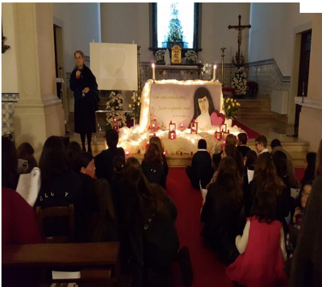
Ilustração 10 . ESPIRITUALIDADE