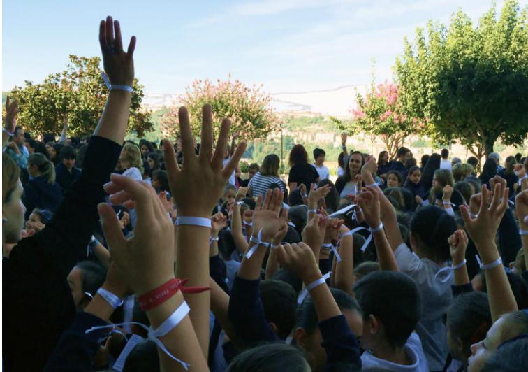
Ilustração 2 - SAUDAÇÃO À NATUREZA