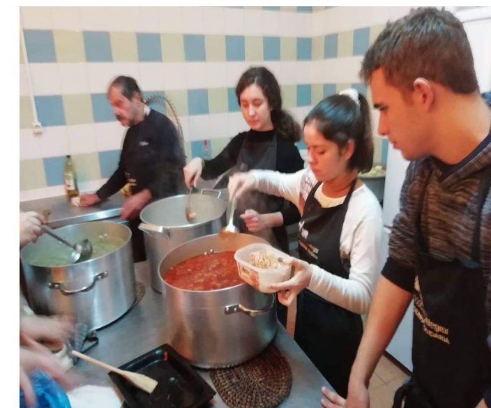
Ilustração 16 - SERVIÇO AOS PODRES