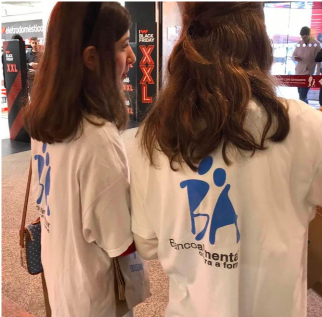
VOLUNTARIADO – BANCO ALIMENTAR