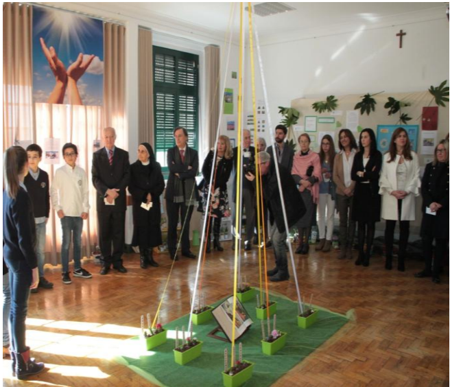
Ilustração 13 - MOMENTOS CULTURAIS