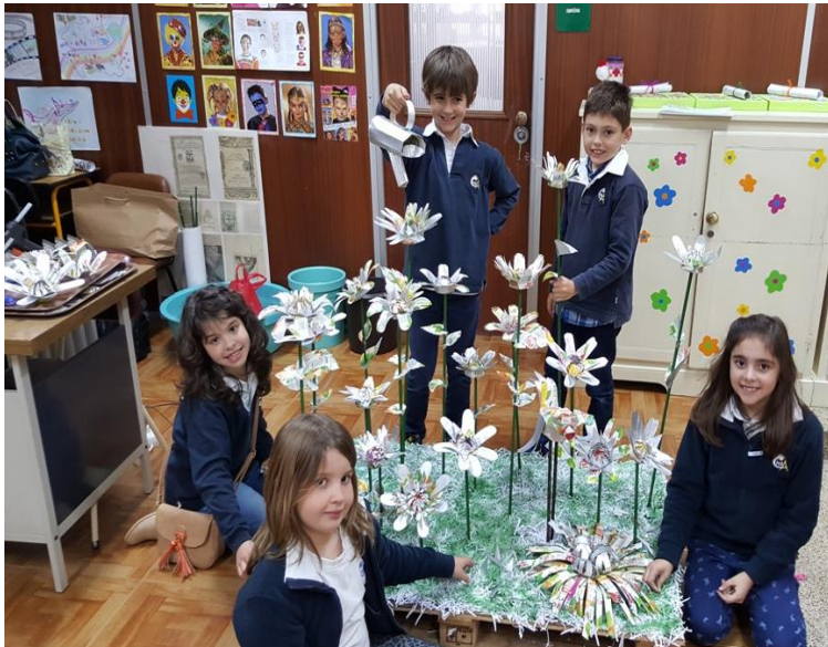
Ilustração 21 - DOS PACOTES DE LEITE ÀS FLORES