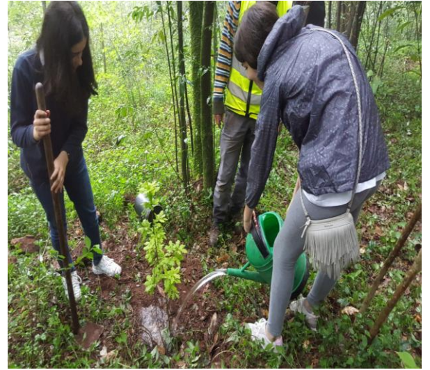
Ilustração 1 - PLANTAÇÃO DE ÁRVORES