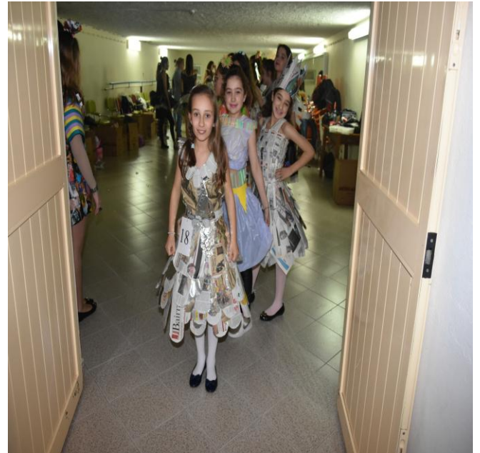
Ilustração 20 - DESFILE LIXO LOOK