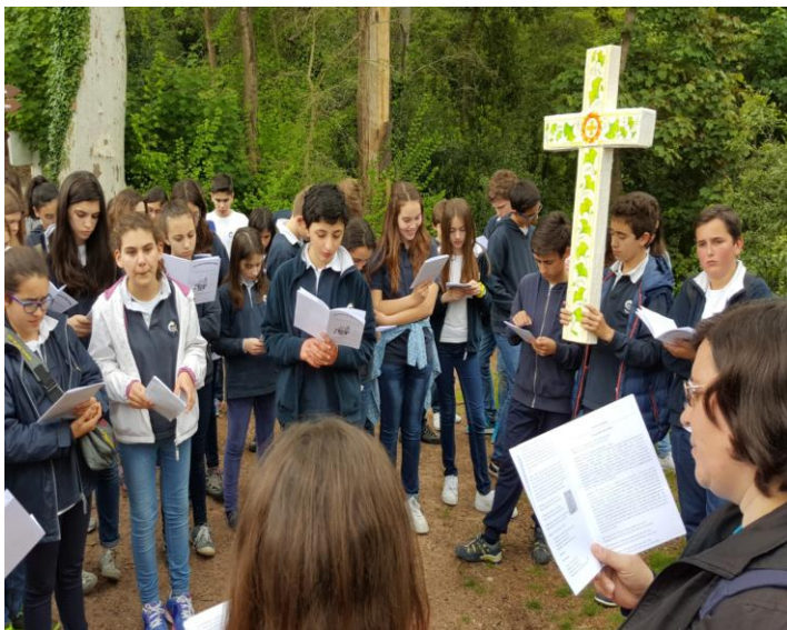
Ilustração 15 - NATUREZA PALCO DE ORAÇÃO