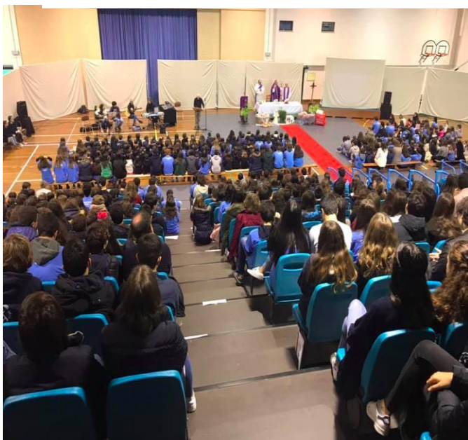
Ilustração 9 - COLABORAÇÃO